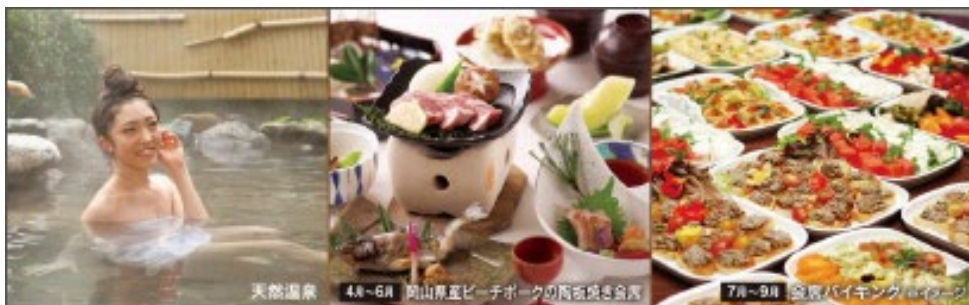
天然温泉 4月~6月 岡山県立ピーチパークの西谷湯きき湯