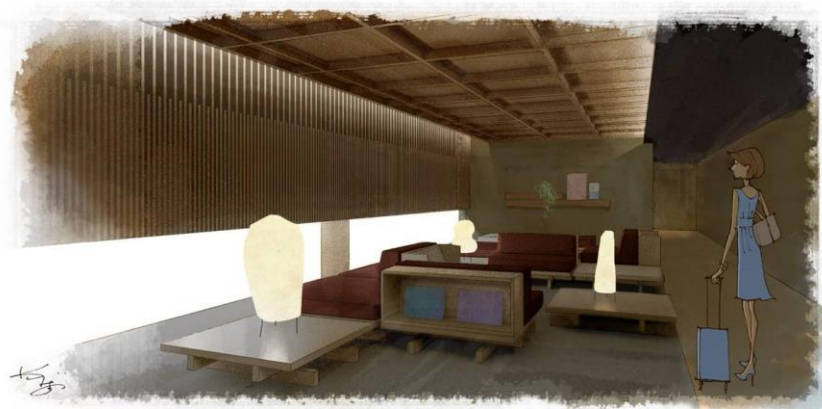
※「リビングロビー」完成イメージ

リソルグループのリソルホテル株式会社は、「ホテルリソル京都 四条室町」を2018年8月1日にグランドオープンいたします。本新築ホテルは、J A三井リース建物株式会社(本社:東京都中央区銀座8丁目)が建築、ホテル運営事業を推進するリソルホテル株式会社が運営を行います。