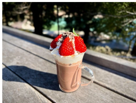
ホットチョコレート 800円（税込）